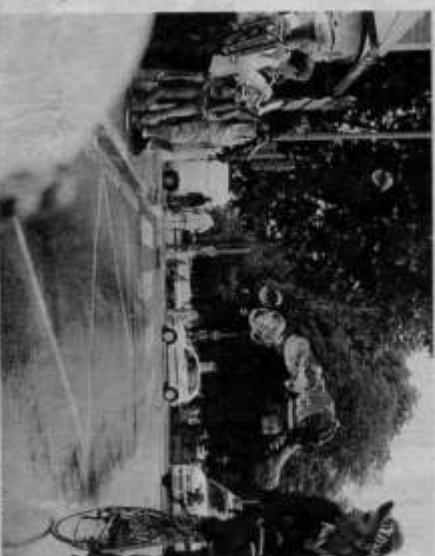
Des bulles pour chasser les nuages qui se sont souvent invités le temps de ces quatre jours de festival

Chalon dans la rue est fini. La 21 e édition a été bouclée sous le soleil. Les 1 000 artistes présents ont une fois de plus ravi un public qui n'a pas hésité à leur rendre hommage à chaque spectacle. Les quelques gouttes de pluie n'ont refroidi personne. Chalon a vécu dans la rue et s'apprête désormais à retrouver le rythme tranquille de son été. Retour final en images sur cette édition.