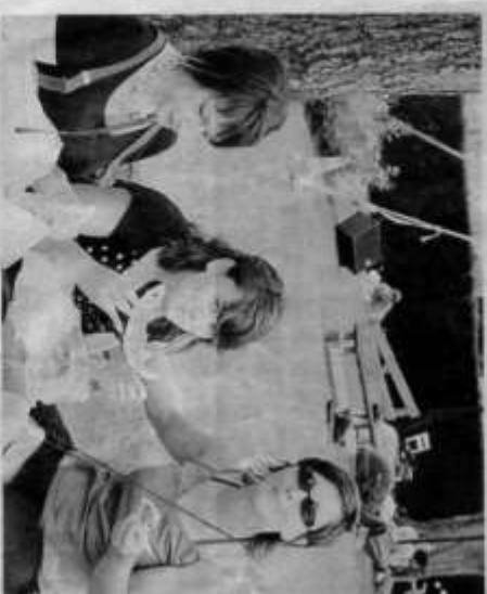
La pastèque pour étancher sa soif