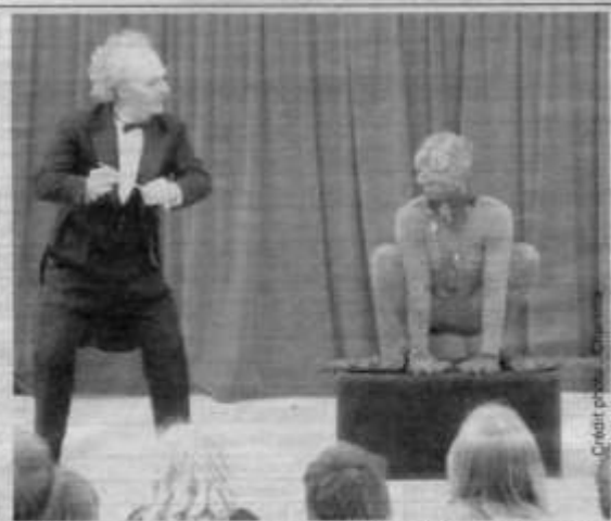
Wolfgang la réincarnation de Mozart version grenouille

Cour de l'école du Centre, samedi et dimanche à 17 h 10. Durée : 1h