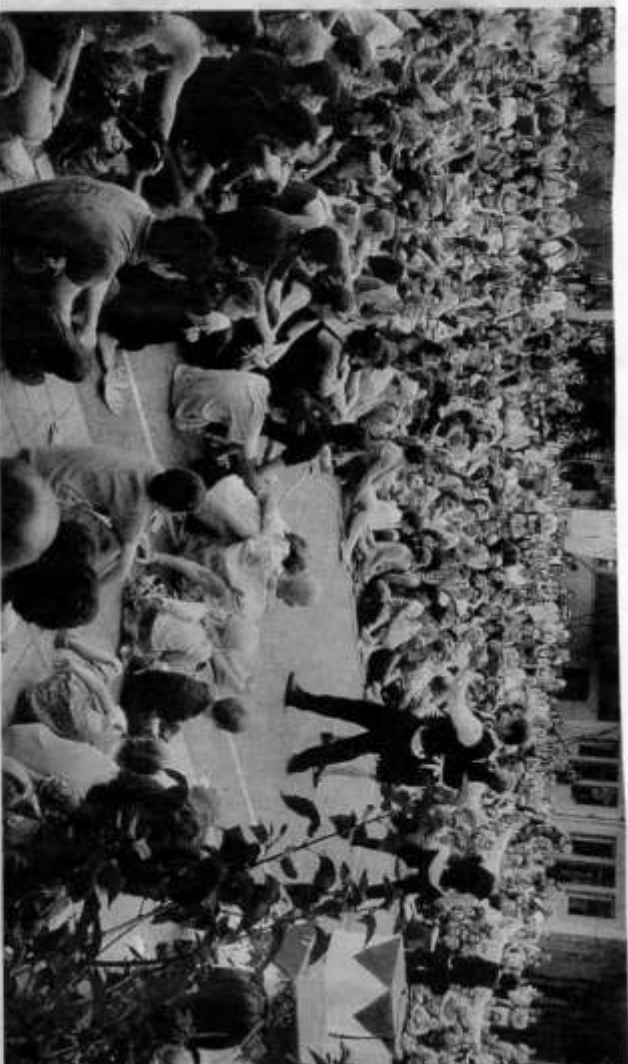
Dans les cours, le public se masse, assiste en nombre aux spectacles. Une salle en plein air en quelque sorte