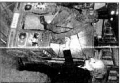
Wolfgang la grenouille s'est attaché au pied Noël !